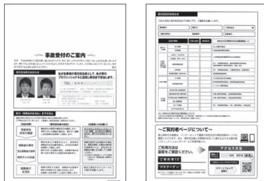
顔写真付の「保険金請求受付のご案内」