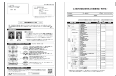
顔写真付の「保険金請求受付のご案内」