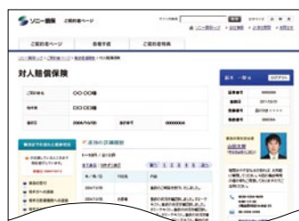
画面例(パソコンの場合)

ウェブサイト上のご契約者ページ(マイページ)にて、お客様のご契約内容だけでなく事故対応状況がいつでもご確認いただけます。また、事故解決までの流れや相手方・関係各所とのやり取りの詳細も確認することができます。