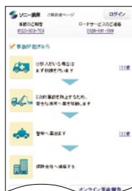
事故受付ページの画面例 (スマートフォンの場合)