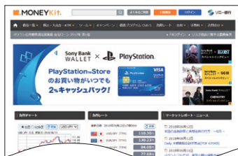
ソニー銀行のサービスサイト(2018年7月現在)

ソニー銀行はソニー損保と損害保険代理店委託契約を結んでおり、ソニー銀行の住宅ローン利用者向けに、火災保険を販売しています。