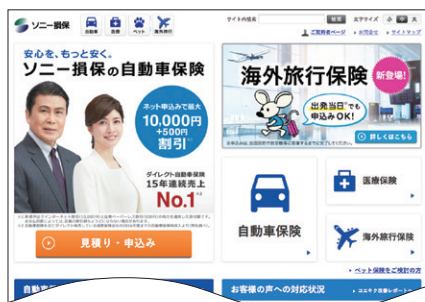
ウェブサイトトップページ (2018年7月現在)

代理店は損害保険会社と代理店委託契約を結び、保険募集を行うことができます。なお、代理店は、保険業法に従い所定の手続きを経て代理店登録や募集人としての届出を行う必要があります。また、登録や届出にあたっては、損害保険募集人一般試験の合格を要件としています。