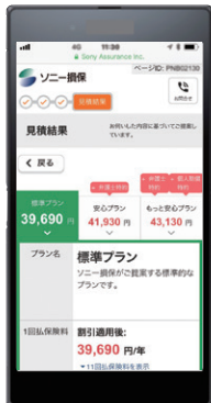
自動車保険スマートフォンサイト見積りページ (2018年7月現在)