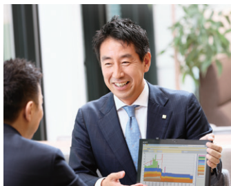
ソニー生命のライフプランナーによる販売

ソニー生命はソニー損保と損害保険代理店委託契約を結んでおり、ソニー生命のライフプランナー(営業社員)がソニー損保の自動車保険を販売しています。