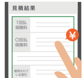
概算保険料をその場で表示