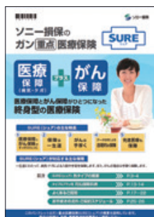
商品パンフレット

(*1) 保障を受けられる方の「満60歳の誕生日以降に最初に到来する保険始期日応当日」以降をさします。