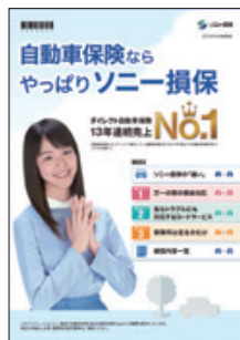
商品パンフレット

マイカーで出かけた際の“お車をおりてから”起こった「外出先でのケガ」「お車の外に持ち出されたモノの損害」「外出先でのトラブルの賠償責任」の事故について補償する特約です。