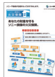
商品パンフレット

建物に必要な補償(火災やガス爆発、盗難などの人的災害や落雷・風災などの自然災害への補償)を「基本の補償」としてあらかじめパッケージ化しており、これに、自宅から発生した火災・爆発などによる近隣住宅・家財への損害を補償する類焼損害補償特約、盗難など不法侵入を伴う犯罪の再発を防止するための費用を補償する盗難等再発防止費用補償特約、日常生活の賠償責任事故に備える日常事故賠償責任補償特約などがセットできます。